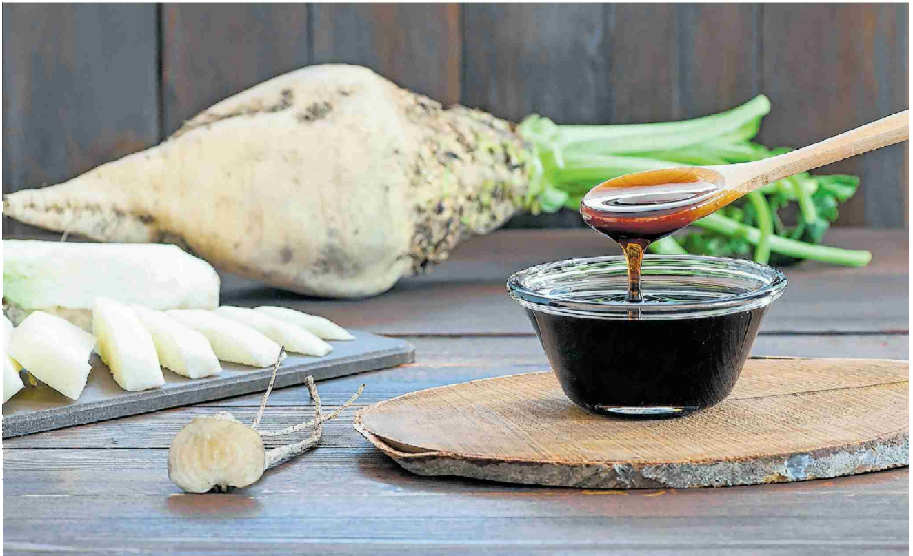
Der neue Trinkalkohol wird aus der Melasse von Zuckerrüben hergestellt.

Der neue Rolls-Royce unter den Schweizer Trinkalkoholen entsteht aus Melasse von Frauenfelder Zuckerrüben.